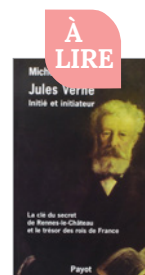
(1) Jules Verne, initié et initiateur Michel Lamy Éd. Payot, 1984, 25 €

d'informations inédites au XIX e siècle. Certains iront même jusqu'à dire que l'écrivain avait accès à des informations secrètes, cachées, non connues de tous. Les mêmes décèlent plusieurs niveaux de lecture dans ses écrits, parsemés de nombreux symboles. En parallèle du récit réaliste se dévoile un récit crypté. Ainsi, José Gregorio Parada Ramirez, auteur d'une thèse sur les influences de la franc-maçonnerie dans l'œuvre de Jules Verne, y recense de nombreux symboles ésotériques d'origine biblique, compagnonique, chevaleresque, alchimique et maçonnique. L'utilisation du soleil, de la lune, des étoiles, de la lumière, de l'eau, de la terre, du feu, de l'air... ne relève pas du hasard, selon lui. Dans Voyage au centre de la Terre , le premier solstice sert de prélude à la descente et l'ombre projetée par un haut pic permet de trouver le bon chemin. Pour preuve, le message qu'Axel, le narrateur de l'his-